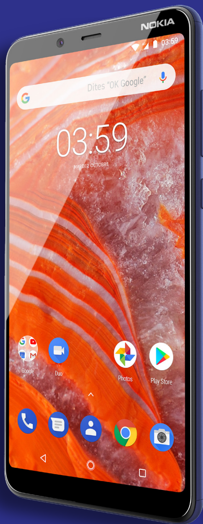
Nokia 3.1 Plus